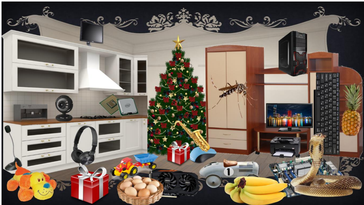
Фиг.2. Първо ниво

В първо ниво (фиг.2) се цели да се проверят знанията на учениците относно основните части на една компютърната система и дали може да ги разпознае измежду множество различни предмети. Ученикът трябва да съумее да открие кутия, два монитора, клавиатура, мишка, видеокарта, процесор, камера, микрофон, слушалки, дънна платка и принтер, за определено време.