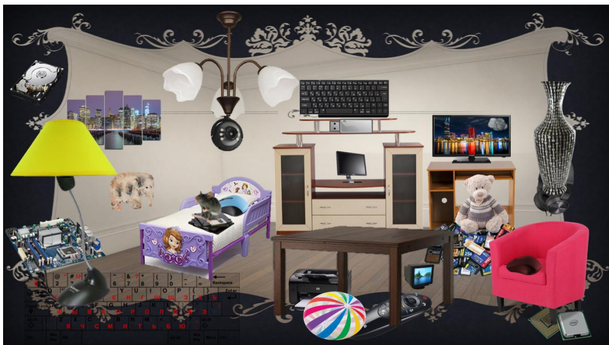
Фиг.3. Второ ниво

Във второ ниво (фиг.3) ученикът трябва да може да разпознава различните видове носители на информация. Предметите, които се търсят в това ниво са: дискета, SD карта, USB флаш-памет, компакт дискове.